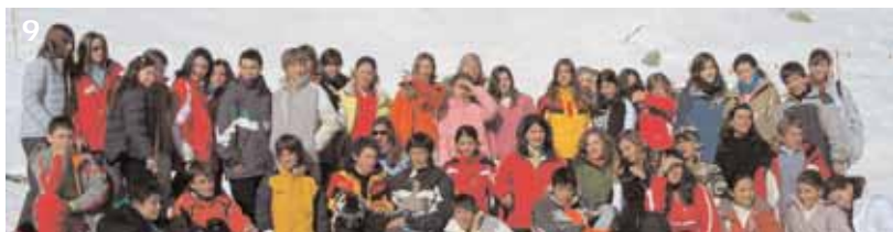
1. Einweihungsfest 2. "ESB Films" präsentiert... - Sekundarschule und Gymnasium 3. Besuch des MACBA - Gymnasium 4. St. Nikolaus im Kindergarten 5. Weihnachtsmarkt - Primarschule 6. Umweltschutz und Recycling - Vorkindergarten 7. Einweihungsfest 8. Mosaik - Primarschule 9. Skilager in Fiesch - Sekundarschule